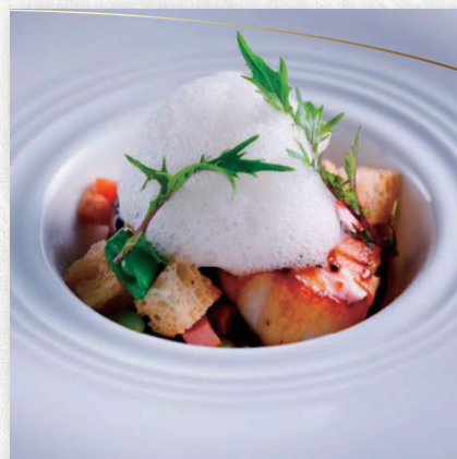
お料理のイメージ

都会の喧騒を離れ、淡路島の静謐なる大地に佇むオーベルジュ。 かつて朝廷に食材を献上したとされ「御食国」と呼ばれた、 ここ淡路島には無限の食材が広がります。 フレンチの森 La Roseでは、和食とフランス料理の絶妙なバランスで 淡路島産の新鮮な食材の魅力を最大限に活かし、 可憐に仕立てたお料理で存分にお愉しみ頂けます。 雄大な大自然の中で、至高の食とゆったりと流れる癒しの時間を。