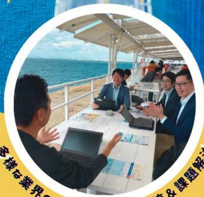
多様な業界の人事担当者との交流 & 課題解決