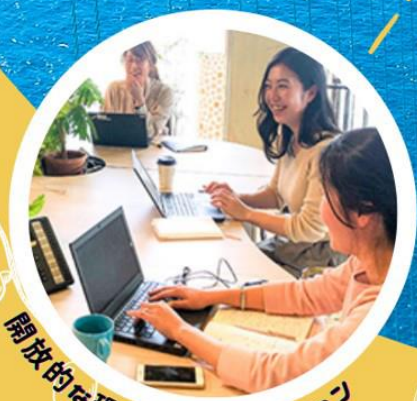
開放的な環境でのワーケーション