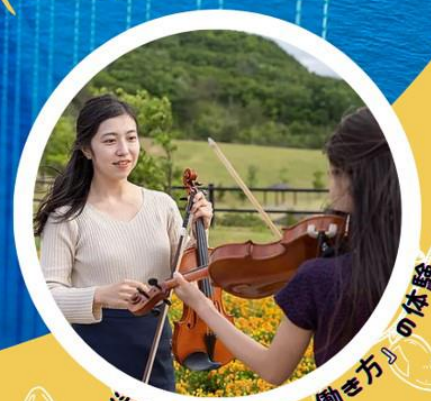
淡路島の『多様な働き方』の体験