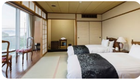
Example of a room (with toilet, no bath) *All rooms have beds